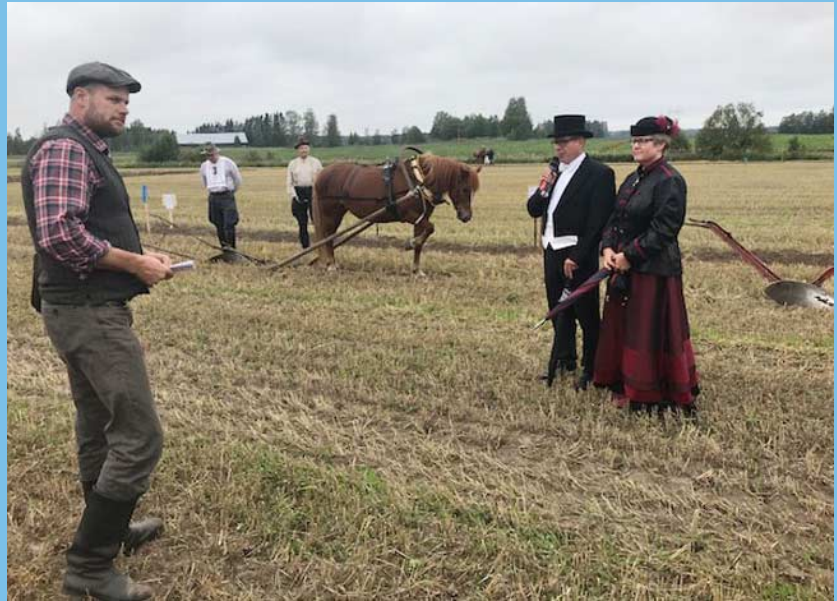
Arvovaltaiset kartanon herra ja rouva avaamassa kyntökisoja.

Valjakoiden ensimmäisenä tehtävänä oli kartanon herran ja rouvan kuljettaminen kyntö-