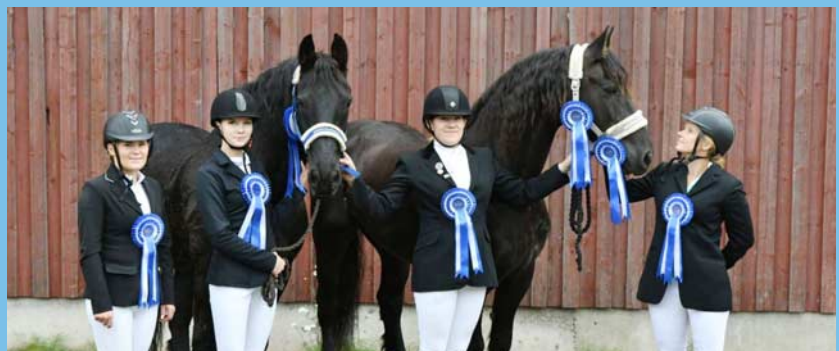
Ohi on ja lounas odottaa kartanon ravintolassa ja karsinoissa.