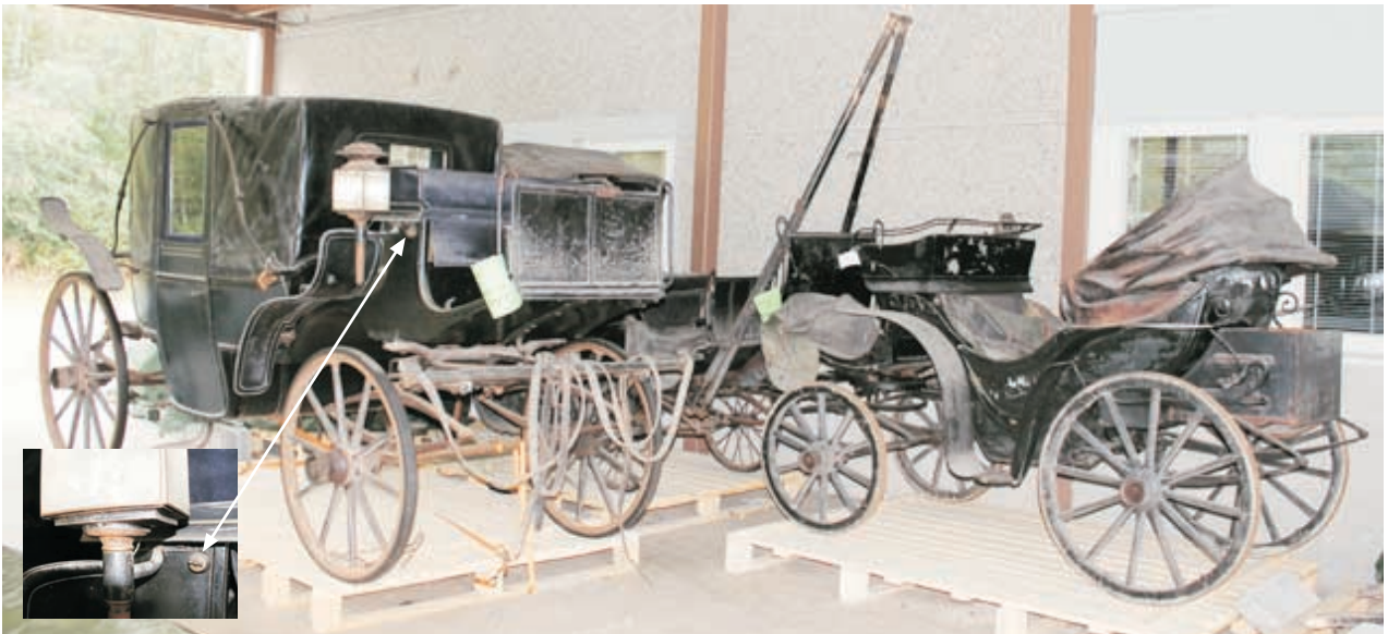
Erikoisuuksiin kuului mm. Jakovlevin vaunutehtaalla Pietarissa valmistunut sähköistetty Landau.